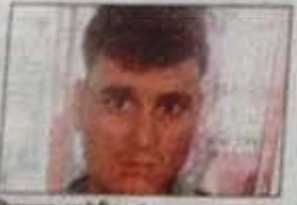
निराकर आरोपी। • हिन्दुस्तान

फैट थाना क्षेत्र के राजेंद्रनगर लेन नंबर 688 में एन.एच.आर.डी एसवी खाना की कोठी है। यहाँ की सामान बरामद करने