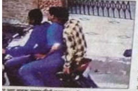
एक बदमाश लूटा छात्रा की मोबाइल। • हिन्दुस्तान